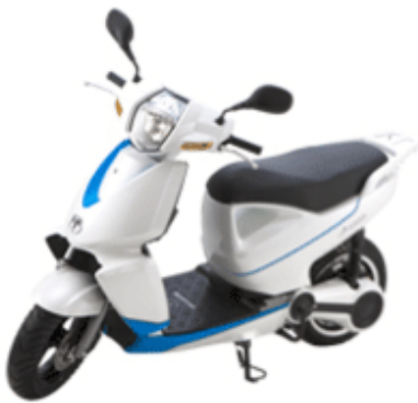
テラモーターズの電動スクーター「A 4000 i」

電動バイクなどの製造・販売を手掛けるテラモーターズ (東京都渋谷区) が、ベトナムで生産を開始した。スマートフォンに接続する新型の電動スクーター「A 4000i」などをホーチミン市の工場から国内外に出荷する。年産能力は当初 1 万台で、将来的には 10 万台に引き上げる。