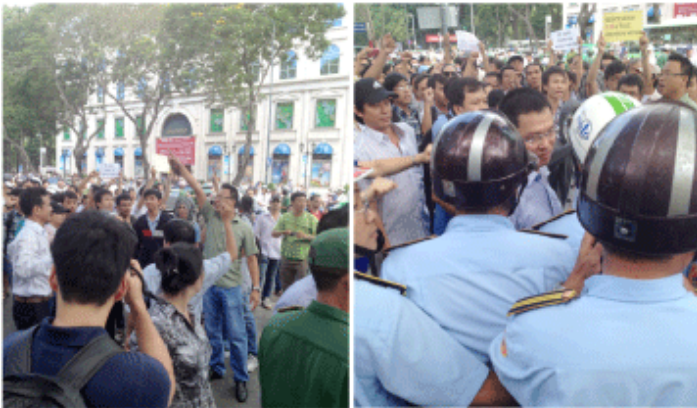
サイゴン大教会前で反中国を叫ぶデモ隊。制止しようとした公安ともみ合いになる=18日、ホーチミン市

南シナ海での領有権問題をめぐって反中デモの一部が暴徒化した問題で、交流サイト(SNS)を通じて週末の反中デモへの参加が呼び掛けられるなど事態の悪化も懸念されたが、当局が過激なデモ活動に対する取り締まりを強化したこともあり、大きな混乱には至らなかった。一時操業を中断していた日系企業の工場も再開するなど反中デモは沈静化の動きを見せている。しかし南シナ海では、越中両国の緊張が続いており、依然として不安がくすぶっている状態だ。